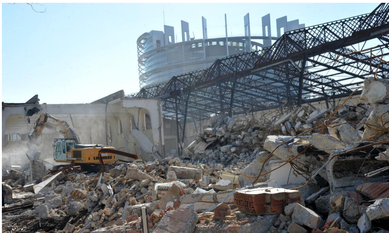
La démolition des halls 9, 10 et 11 du parc des expositions du Wacken, et de ce qui fut le Jardin des délices de la Foire européennes.

Le chantier avait été lancé le 26 février. À écouter les spécialistes, il ne s'agit pas d'un chantier très compliqué, les bâtiments étant de facture somme toute simple. Les halls 9 et 11 ont été construits à la fin des années 20 pour accueillir toutes sortes de foires et salons. Dans les années 50, le hall 10 a été ajouté. En fait, il s'agit d'une vaste verrière sur charpente métallique, couvrant l'espace entre les deux premiers halls. Bref, de gros volumes couverts de verrières avec peu de murs. D'ici à la fin du mois, le Jardin des délices ne sera plus qu'un souvenir et un tas de béton et